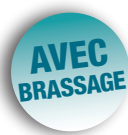
Tableau de communication NÉO QUAD grade 1